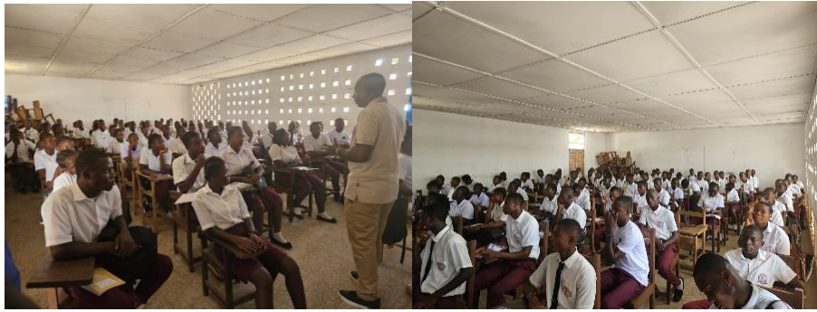
Communauté de Glofaken – VSLA, les chefs et la population locale, AFA Suisse